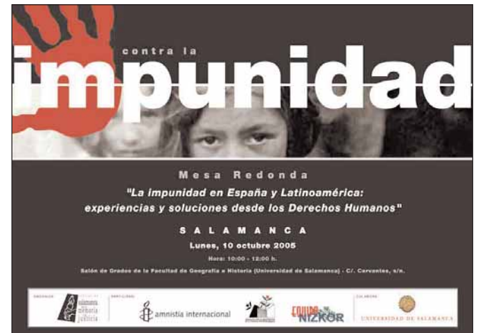
Cartel de una mesa redonda sobre el tema.

● Asegurar las exhumaciones con garantías judiciales y forenses .