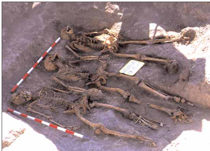
Los paseados de Velilla (Valladolid)

Orosia Castán se refirió al trabajo realizado por los forenses de la ARMH de Valladolid. Entre los ejemplos que puso, nosotros destacamos la exhumación llevada a cabo el pasado 23 de agosto en Velilla, población que en 1936 tenía 371 habitantes. Allí fueron hallados los restos de un padre y