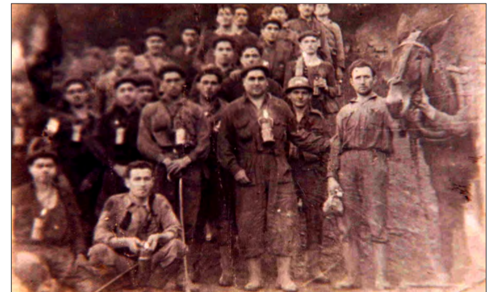
Mineros de Fabero.