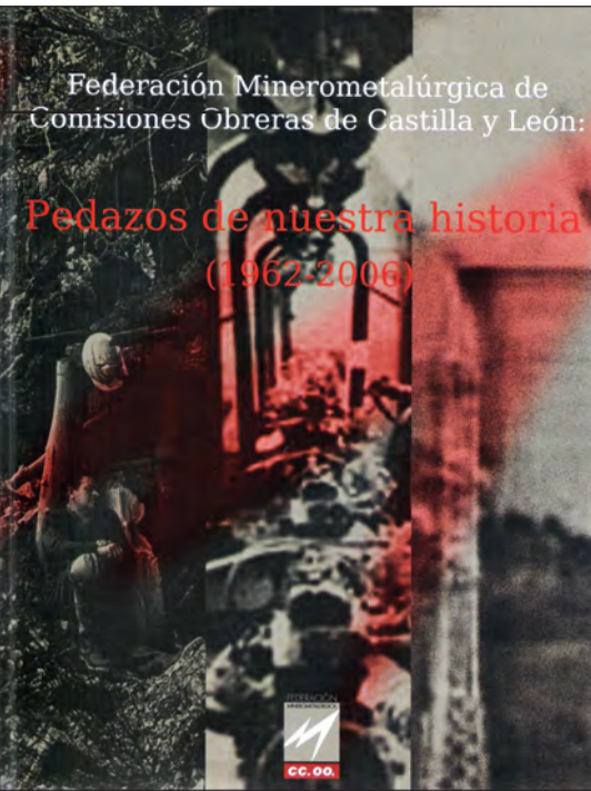
Federación Minerometalúrgica de Comisiones Obreras de Castilla y León: Pedazos de nuestra historia (1962-2006)

trabajadores pensarán que rehuimos comprometernos en su defensa. Además, actuaremos más seguros con su representatividad". En zonas como Laciama se ganaron las elecciones.